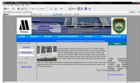
Gambar 4.1. Tampilan Home